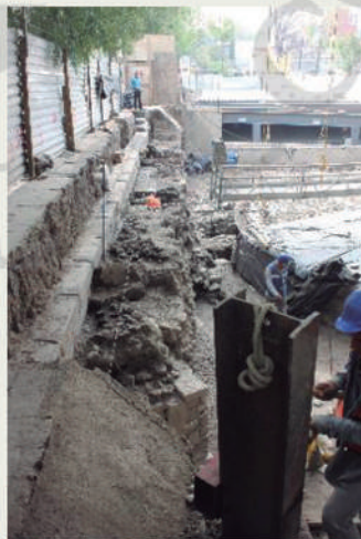
Vistas de este a oeste y de oeste a este del corte norte de la banqueteta de la Avenida Flores Magón. Se aprecian los encofrados de concreto de TELMEX que descansan sobre inmuebles prehispánicos