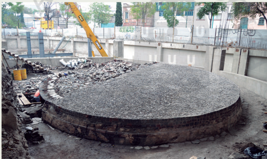
Vista de Noroeste a Sureste. Se aprecia la moldura de la base del cuerpo circular

Este templo bicónico fue cubierto por su siguiente fase constructiva completamente circular y perfil un poco inclinado hacia el vértice superior a bien de lograr su equilibrio por gravedad y que sólo presenta una pequeña moldura que marca su base y separación de la vertical del mismo cuerpo.