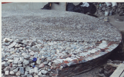
Vista de Noreste a Suroeste. Perfil bicónico del cuerpo circular de la primera etapa constructiva del Templo

El edificio tiene dos etapas constructivas sobrepuestas: la primera de planta circular y perfil bicónico, siendo el primer edificio asociado a la cultura mexicana de esta forma que sólo se había registrado en la huasteca Veracruzana del área del Totonacapan, como el edificio llamado Xicalcolihqui de Tajín o el edificio D de Tamuín en San Luis Potosí.