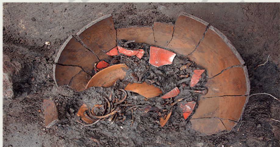
Ofrenda con restos de infante en olla de cerámica

Dentro de todo el predio explorado se localizaron restos de piezas de cerámica, obsidiana, lítica, madera principalmente prehispánicas y coloniales, ya que como he mencionado, durante la década de los años 60 del siglo XX, el predio fue arrasado con maquinaria para construir el centro comercial. Existen piezas que realmente destacan por su belleza.