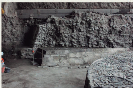
Inmuebles prehispánicos bajo la calle Flores Magón y de los que sólo se recuperó una parte para este espacio público

El Templo Circular con sus dos etapas constructivas ocupan la mayoría del predio recuperado para su protección; sin embargo, en el corte norte justo bajo la banqueteta y calle de tránsito vehicular se localizan más inmuebles prehispánicos de los cuales sólo hemos recuperado su mínima parte, ya que no podemos explorar el terreno por las necesidades rutinarias de nuestra ciudad.