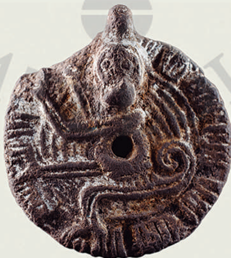
Sello de ozomatli (mono) numen de Ehécatl, dios del Viento