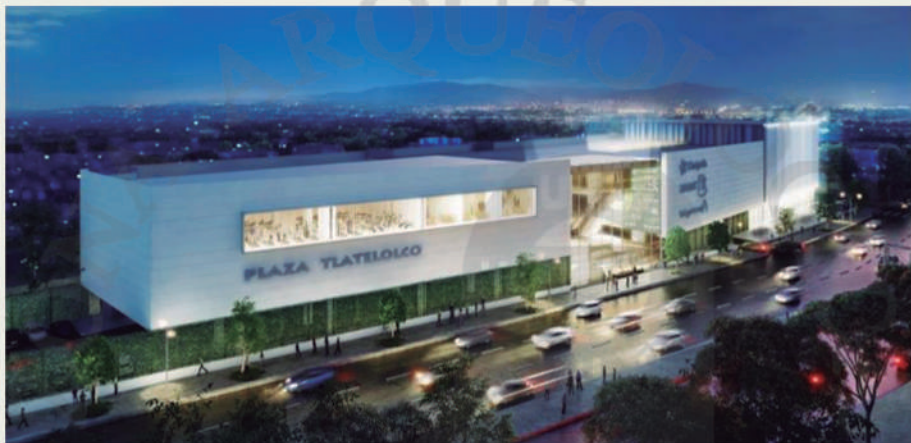
Modelo Digital de la Plaza Comercial. DI Lucio, S.A.

Los ritmos del tiempo siempre desembocan en sorpresas ante la rutinaria vida de la Ciudad de México; así, en 2014 durante los trabajos de salvamento arqueológico que desarrollamos acorde a la ley en la materia dentro de la remodelación del antiguo centro comercial "El Sardinero" ubicado en la calle de Flores Magón esquina con Lerdo, al oeste, y Mercado, al oriente, tuvimos la fortuna de descubrir un templo prehispánico de planta circular con su fachada principal adosada y orientada al este.